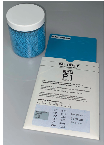
Bild 2. Als Referenz für die Analysen dienen RAL-Farbkarten.

In der Softwareoberfläche Docu werden die letzten 100 Messungen angezeigt sowie die Abweichungen in L^* , a^* und b^* zur eingegebenen Referenz. Die Messdaten können in einer Datei abgespeichert werden. Diese lässt sich anschließend beispielsweise mit Microsoft Excel öffnen.